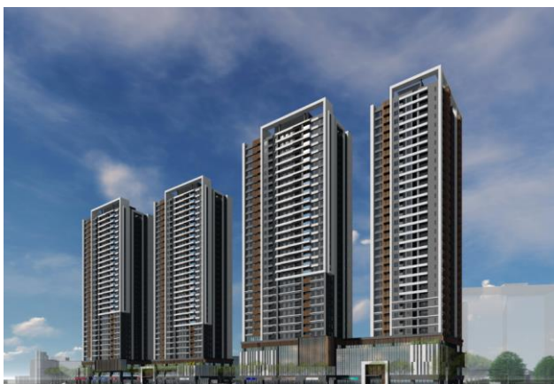
「中和板南路案(暫稱)」完成予想 CG ①

事業夥伴的國泰建設是台灣營建業第一家股票上市、於 1964 年創業、擁有悠久歷史的建設公司、在住宅方面無論是商品企劃以及品質都獲得高度評價。除此之外、國泰建設也是三井不動產集團在台灣的飯店事業「敦化北路 HOTEL(暫稱)」的合作夥伴。三井不動產集團未來也將會活用至今為止於日本國內外所培養及累積的住宅開發經驗及知識,與國泰建設共同在台灣以大規模住宅開發為中心持續推展住宅事業。