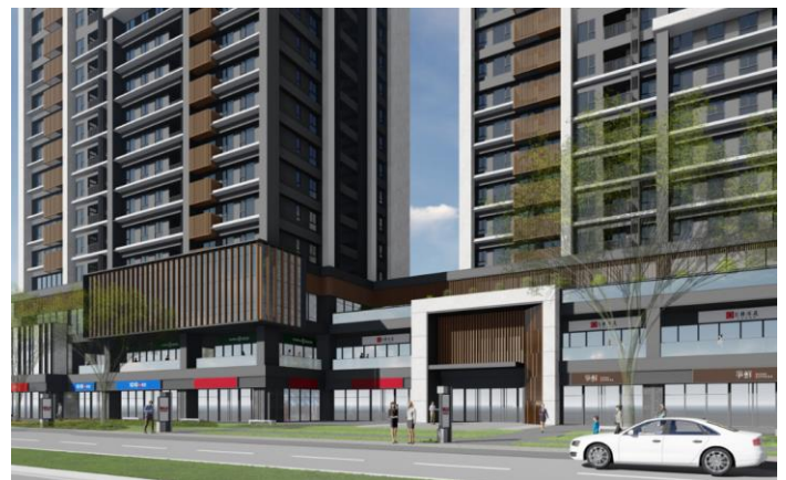
「中和板南路案(暫稱)」完成予想 CG ②