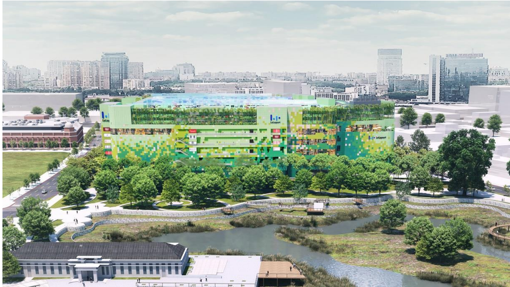
湧泉公園與 C 棟外觀示意圖