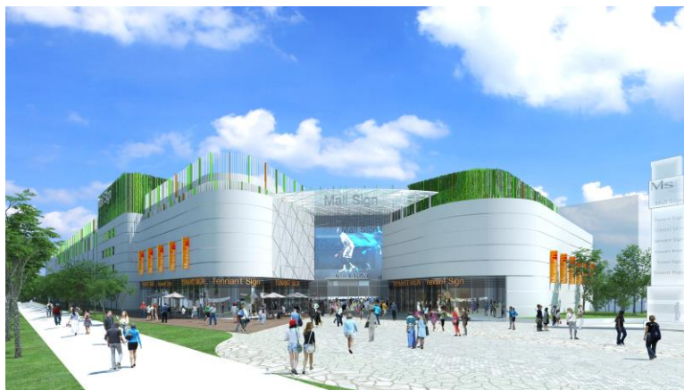
「林口媒體園區」複合式商業設施開發計畫 完工預想示意圖

目前本公司在台灣正著手推動 3 項「OUTLET」事業與 2 項「LaLaport」事業，合計將打造共 5 座商業設施（與馬來西亞、中國等亞洲其他地區共計 10 座設施）。本集團已於日本國內外打造共超過 100 座的商業設施，本次將徹底活用過去於開發、店鋪招商、營運方面累積的知識與技術，今後亦將傾注全力，更進一步地擴展海外事業。